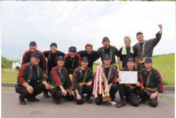
優勝した壱ツ屋自衛消防隊の皆さん