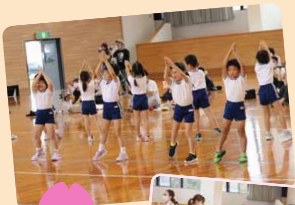
橘保育所 さくら組