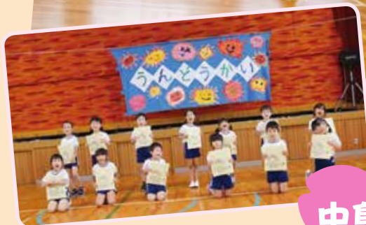
中島保育所 さくら組