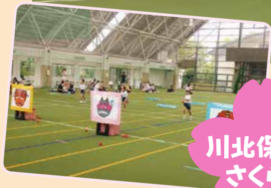
川北保育所 さくら組

9月26日に町内3保育所さくら組(年長児)のお楽しみミニ運動会が開催され、子ども達はかけっこや鼓隊演奏などの種目に力いっぱい取り組みました。 今回の保育所運動会は、感染症対策のため、会場を保育所別に分け、さくら組の子ども達と家族の方のみで行われました。 また、さくら組以外の子ども達は、9月下旬から10月上旬にそれぞれの保育所で運動会ごっこを楽しみました。 その様子を紹介します。